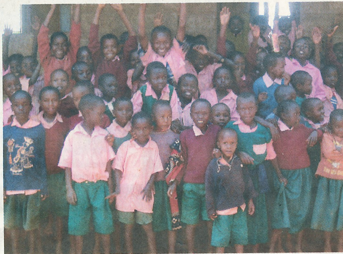
Die von Hakuna Matata unterstützten Kinder vor ihrer Schule. Weitere Kinder suchen noch Paten.

V ielen Dank, dass Sie es mir ermöglichen, in die Schule zu gehen und auch für die neue Schuluniform. Zum ersten Mal in meinem Leben habe ich ein paar ganz neue Schuhe bekommen.“